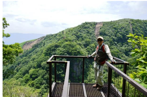
倶利伽羅展望台の私