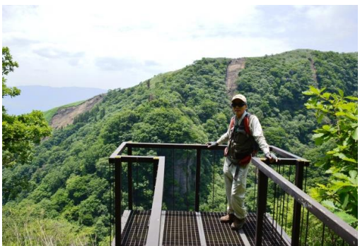
倶利伽羅大滝展望台