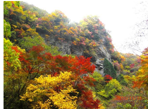
倶利伽羅谷の紅葉