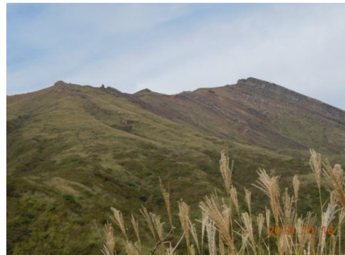
倶利伽羅尾根より中岳南峰を望む (右側が南峰三段岩)