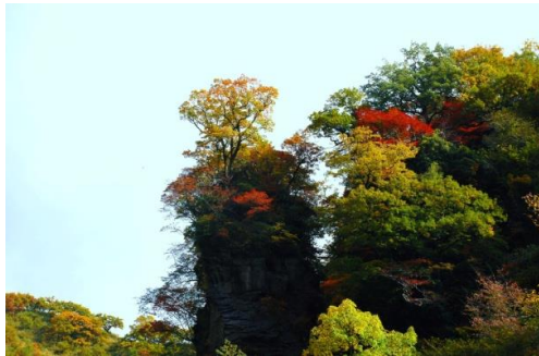
倶利伽羅谷、沢の入り口、岩の塔 (紅葉の時)