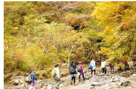
倶利伽羅谷のトレッキング