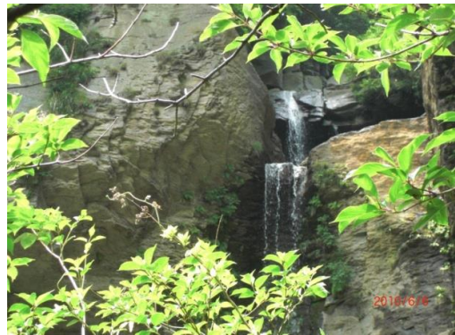
倶利伽羅大滝上部ズームアップ