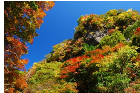
倶利伽羅谷岸壁の紅葉